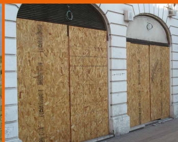
IDENTIFICACIÓN DE OBRAS